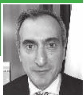
Ιερόθεος Παπαδόπουλος Επικεφαλής Αντιπροσωπείας της Ευρωπαϊκής Επιτροπής στην Κύπρο